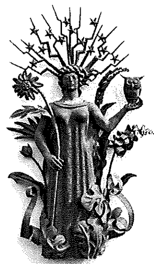
« La science et l'esprit », Alfred Janniot, Lycée Marcel Mézen,

Ce dispositif permet ainsi à des artistes de tendances diverses de créer des œuvres pour un lieu de vie quotidien, de collaborer avec des architectes, mais surtout d'éveiller et de sensibiliser le public à l'art contemporain, en dehors des institutions spécialisées.